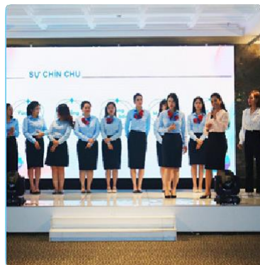
Chương trình đào tạo tác phong chuyên nghiệp