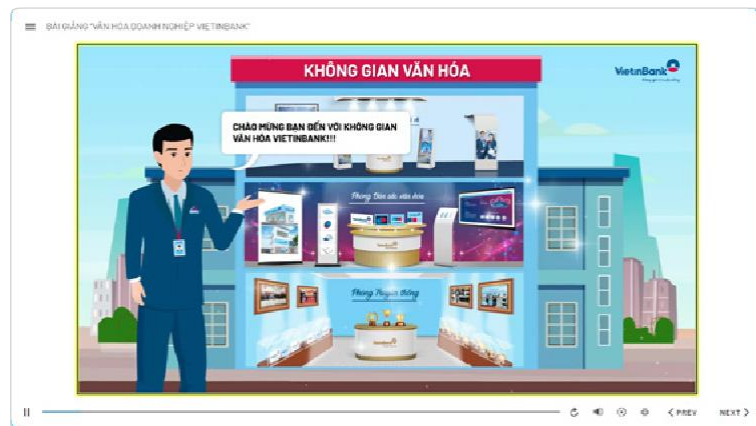
Chương trình đào tạo E-learning toàn hàng về Văn hóa doanh nghiệp

Các CBNV được tham gia các hoạt động đào tạo xây dựng bản sắc và hành vi văn hóa theo các chương trình đào tạo toàn hàng và từng đơn vị.