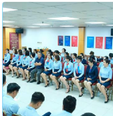
Chương trình đào tạo giao tiếp thanh lịch