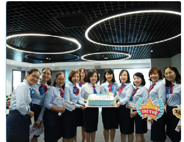
Hoạt động xây dựng Bản sắc Văn hóa VietinBank tại các đơn vị